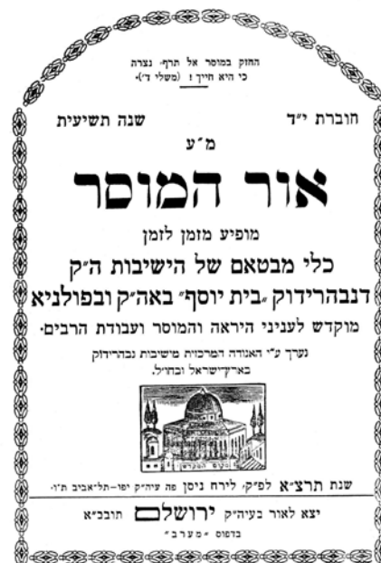
החוברת הראשונה של אור המוסר שנדפסה בארץ ישראל, 1931

יותר מכל הישיבות הגדילה לעשות זו האוסטרובצית, שהחלה להפיץ כתב עת דמוי אור המוסר – ירחון מודפס (!) ושמו חיי המוסר שיצא לאור בשנים 1935-1937, 88 והמשכו באָל המבקש המודפס גם הוא,