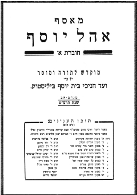
החבורת היחידה של אהל יוסף, ביאליסטוק 1939

קולה בראש כל חוצות מקצה הארץ עד קצהו, התאגדות הישיבות והרוח תקיף העולם ומלואה". 97 הצלחה זו לא באה יש מאין. במקום שבו כשלה שיטת "כתיבת המכתבים" נדרשה העיתונות לחדשנות ולנמרצות בשאיפתה להגביר את רוח ההתאגדות בתוך התנועה. ישיבות נוברדוקאיות לא מעטות יזמו הוצאת ביטאונים משלהן, שאלו רעיונות מהעיתונות הכללית, הוסיפו מדורים מושכים וניסו להרחיב את תפוצתם באמצעות פנייה לתלמידי ישיבות עמיתות. אולם היה לכך גם מחיר. כבר בגיליונו הראשון נאלץ הד המוסר המזריצי להתמודד עם ההתנגדות הטבעית שהופעתו צפויה הייתה לעורר בקרב תלמידי הישיבה, והקדים תרופה למכה באמצעות הפליטון "שיחה אודות העתון":