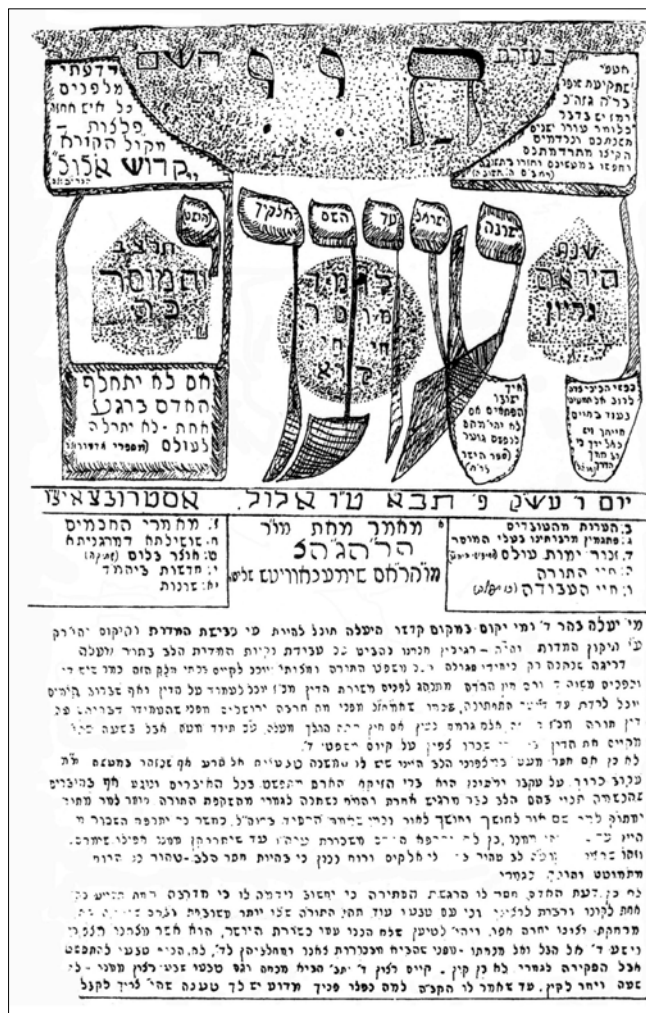
ראש גיליון כ"ה של חיי העובדים, אוסטרובצה 1932

האומנם תרמו כתבי עת ישיבתיים פנימיים אלה ליצירת רוח ההתאגדות המקווה? יתרונם העיקרי – שלא כ"כתיבת המכתבים" – טמון היה באפשרות הפצתם בו בזמן בקרב קהל נרחב של תלמידי ישיבות עמיתות. 63 ואכן, על אף התרכזותם בעשייה של הישיבה המקומית הם התייחסו לא רק לחניכיה או לצעירים שבסניפיה אלא לחברי התנועה הנוברדוקאית כולה, ואפשר למצוא בהם פניות שמיות מפורשות אל תלמידי ישיבות אחרות. הדבר בולט בעיקר במדורי הזמנות שרשרת, שהיו מעין חיזוי למדורים מקבילים במדיה