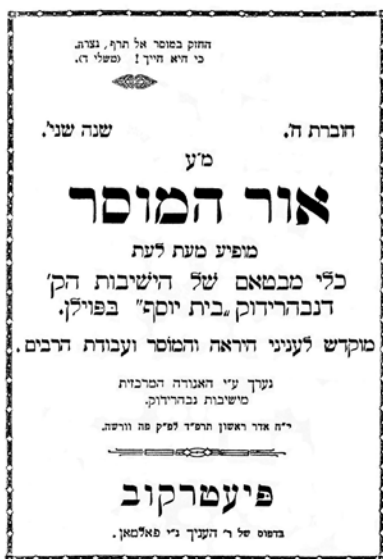
החוברת המודפסת הראשונה של אור המוסר, פולין 1924