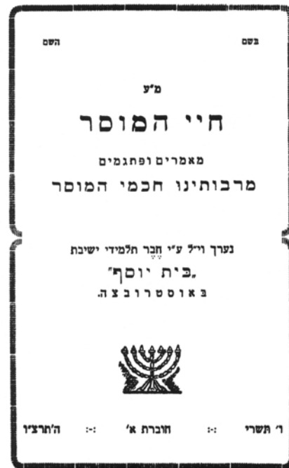
החוברת הראשונה של חי המוסר , אוסטרובצה 1935

לכאורה התשובה טמונה בפריסה המיוחדת של ישיבות התנועה: פיצולן הגאוגרפי שנוצר כבר בתקופת מלחמת העולם הראשונה ונמשך גם לאחריה חייב התארגנות מתאימה ליצירת קשרים בסיסיים ביניהן – אם בצורת "כתיבת המכתבים" ואם באמצעות כתבי עת. אולם דומה שהסיבה עמוקה יותר. לאחר מלחמת העולם הראשונה הואצו תהליכי החילון בחברה היהודית במזרח אירופה. לפני הנוער נפתחו שעריהם של כל מוסדות הלימוד, כולל גימנסיות יהודיות לגוניהן. הישיבות הליטאיות פסקו מלשמש בתי אולפנה יהודיים יחידים ואף חדלו מלהיחשב בציבור הרחב כמוסדות עילית אינטלקטואליים. והנה בתוך עולם ישיבות זה, שפג כביכול זהרו, מצאו אלה הנוברדוקאיות – הלא נורמטיביות – את עצמן בקרן זוית, אם מחמת חריגות ואם מנטייה רצונית להתבדלות. בכוחה של העיתונות היה להפיג רגש בדידות זה בהפיחה בין אלפי חברי תנועת נוברדוק רוח של התאגדות – "הוא אחד מהיסודות והעמודים החזקים בכלל ובפרט, שיצר לכל אחד רוח חזק ורבי-גאון, שכל הרוחות שבעולם לא יזיזו אותו ממקומו, בהרגישו עולמו המיוחד במלא מובן המלה". 96 ואכן, נראה שעיתונות זו הצליחה במשימתה. משהחלה התנועה להתפשט מחוץ לגבולותיה הגאוגרפיים הטבעיים אף יצא אחד הביטאונים הנוברדוקאים בהצהרה יומרנית רבת ביטחון: "העבודה תתפשט ותתרחב בהשקפה רחבה – השקפה עולמית, רוח העבודה יתעורר בכל תפוצות הגולה ובארץ, רוח המוסרי יתפעם בכל לב בן תורה ויראה, רוח של הרבצת התורה והרבות מבקשים תן